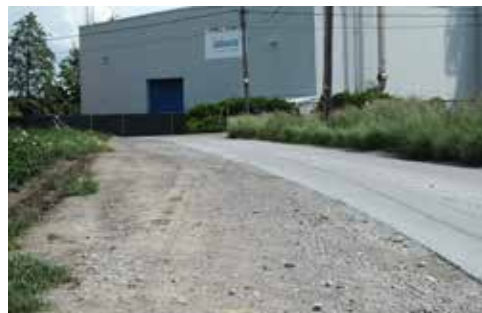
▲ En dat terwijl een bredere Sint-Amandstraat een goed alternatief zou zijn voor die zware voertuigen.