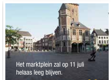
Het marktplein zal op 11 juli helaas leeg blijven.

De nieuwe meerderheid opteert dit jaar voor een kort optreden in Cultuurcentrum Gildhof, met een beperkt aantal zitjes. Weg volksfeest, weg folklore, weg 'samen Vlaming zijn'. 'Iedereen Tielt', maar helaas niet op de Vlaamse feestdag.