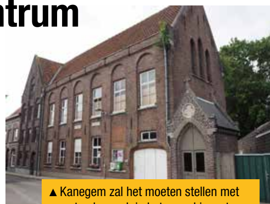
▲ Kanegem zal het moeten stellen met wat opknapwerk in het parochiecentrum.