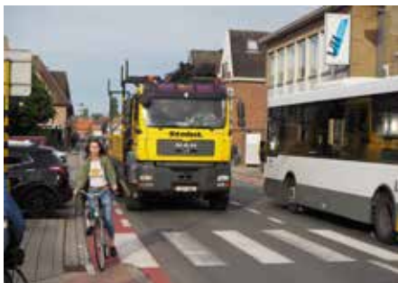
▲ Voor zwakke weggebruikers in de Conventieweg blijft het opletten voor zwaar verkeer.

Maar de nieuwe bestuursploeg schraptte ondertussen de budgetten voor de verbreding van de Sint-Amandstraat. De meerderheid zet opnieuw in op de realisatie van de zuidwestelijke tangente. Of die er ooit komt, is echter nog maar de vraag. Intussen blijft het zwaar verkeer door de drukke centrumstraten razen en blijven de zwakke weggebruikers er hun hart vasthouden.