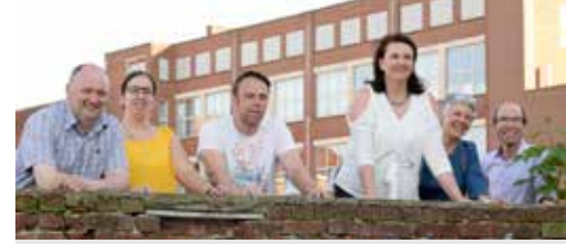
N-VA werkt voort p. 3