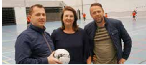
Onze kandidaten geven de aftrap p. 2